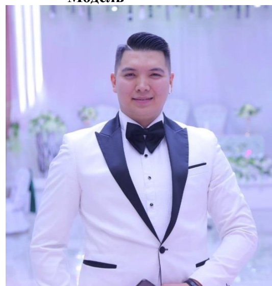
Байшагиров Темирлан Шоумен