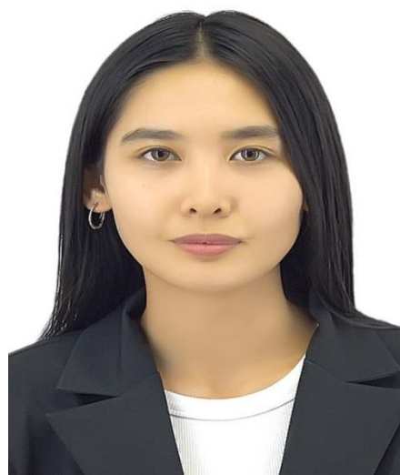
Кабышева Саня Секретарь специализированного межрайонного суда Жамбылской области