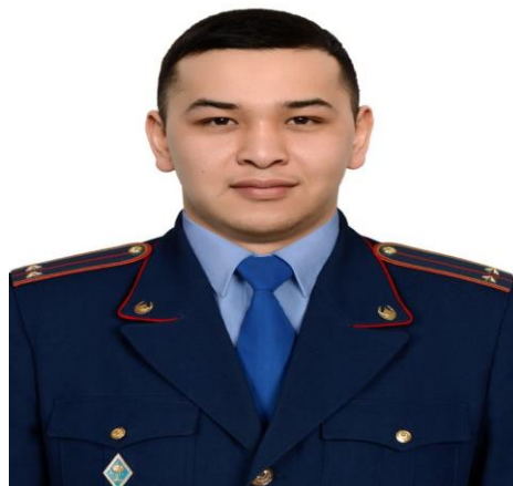
Самбет Мархабат БПШ ДП Карагандинской области