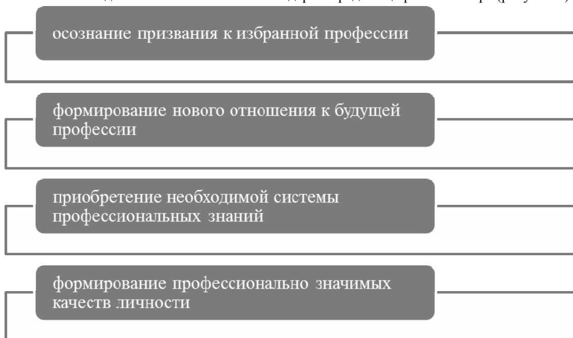
Рисунок 1. - Содержание процесса адаптации первокурсников военной школы к профессиональной подготовке

- осуществлении жизненных и профессиональных планов на основе принимаемых социально-приемлемых и личностно значимых решений. Ввиду этого второй этап адаптации к профессиональной подготовке в военной школе содержит ряд специфических черт (рисунок 1).