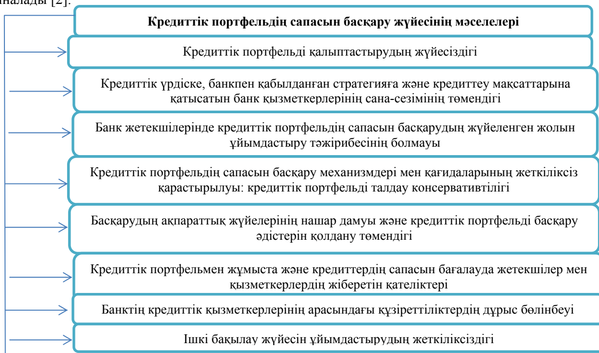
Сурет 1. Кредиттік портфельдің сапасын басқару жүйесінің қателіктері

Банктің кредиттік портфелі – бұл әр уақытта банк берген несиелердің жиынтығы. Алайда, егер бұл жай ғана несиелер тізімі емес, Несиелер үшін маңызды белгілі бір критерий (критерийлер) бойынша құрылымдалған жиынтық болса, онда "кредиттік портфель" берілген несиелер сапасының және тұтастай алғанда банктің барлық несиелік қызметінің сипаттамасына айналады [2].