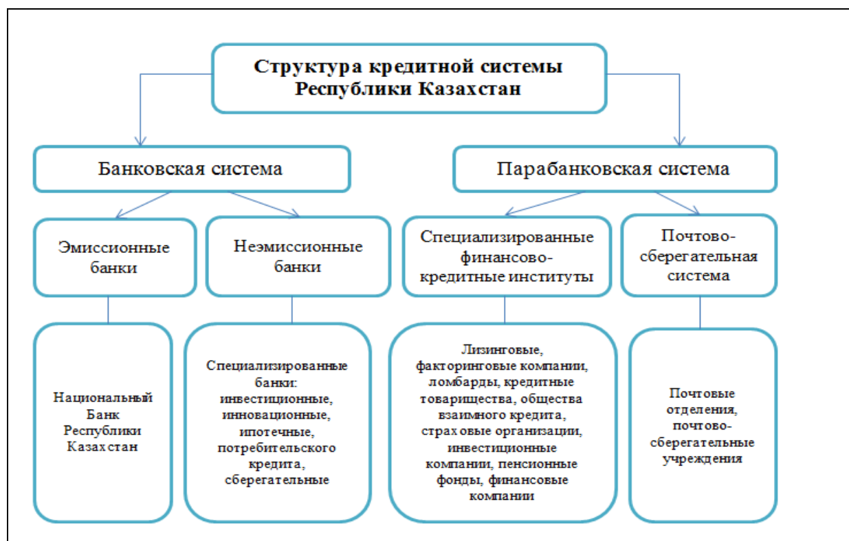
Рисунок 1. Структура кредитной системы Республики Казахстан

Национальный Банк Республики Казахстан в качестве центрального банка государства вовлечен в процесс вхождения Республики Казахстан в систему мирохозяйственных связей. С момента обретения независимости, Республика Казахстан поддерживает торгово-экономические отношения с государствами-членами ООН, а также установила тесные отношения со странами партнерами. В этой связи Национальный Банк, исходя из своих целей и задач, направленных на поддержание финансовой стабильности, активно начал вовлекаться в интеграционные процессы, а также изучать опыт центральных банков развитых стран.