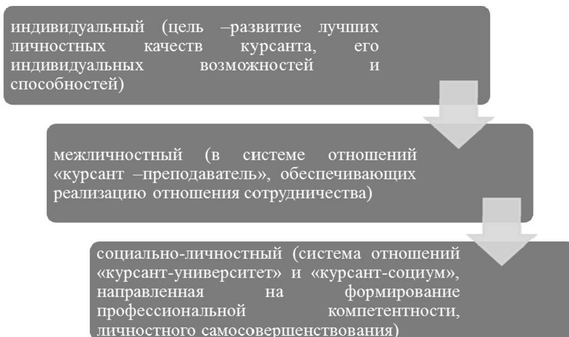
Рисунок 3 - Уровни адаптации первокурсников к обучению в военной школе

Эффективная адаптация первокурсников к обучению в военной школе строится на основе трех уровней воздействия, оказываемых со стороны военного учебного заведения (рисунок 2).