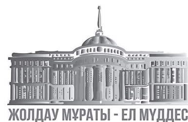
ЖОЛДАУ МҰРАТЫ - ЕЛ МҮДДЕСІ