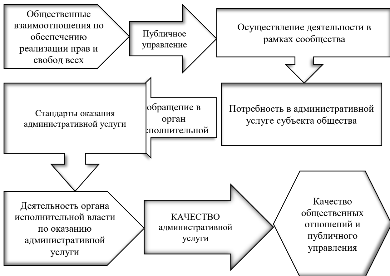
Рисунок 1 – Общий механизм оказания административной услуги в системе публичного управления (авторская разработка)

Следует понимать, что потребность в административных услугах возникает исключительно в сфере осуществления глубоко социализированной деятельности и имеет целью обезопасить всех участников общества от нарушения прав и свобод других людей [1,3]. Механизм предоставления административной услуги возможно рассматривать в такой принципиальной схеме (рисунок 1), которая рассматривает качество административной услуги как результирующий показатель деятельности всей системы публичного управления в контексте реализации концепции NPM.